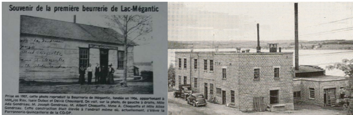
Beurrerie en 1907